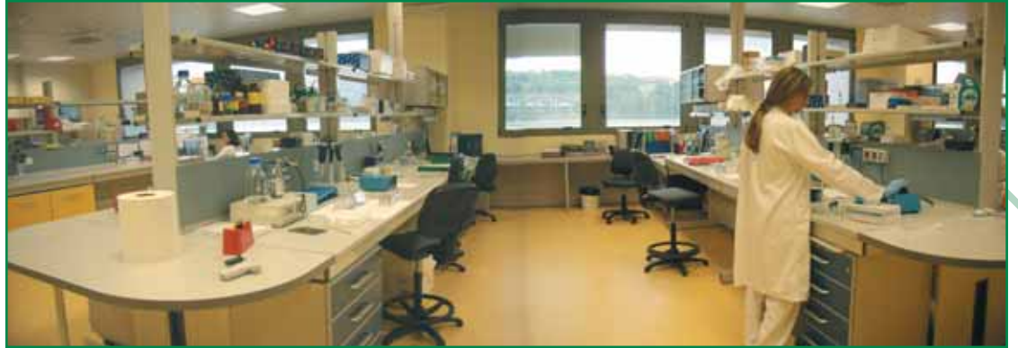
Laboratorio IRST

La certificazione ambientale EMAS, conseguita da C.A.C. nel 2004 al termine di un laborioso percorso che ha coinvolto tutte le funzioni aziendali, è prova di come questa filosofia sia applicata nella pratica quotidiana.