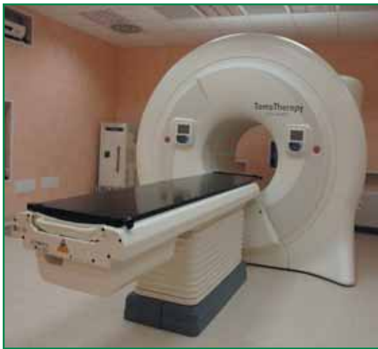
Macchina per tomoterapia

La Direzione e il Consiglio di Amministrazione di C.A.C.