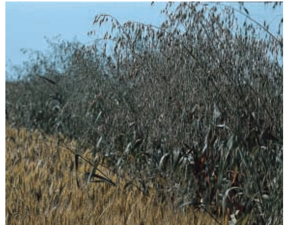
Fossi e scolli: sono ricettacoli di ogni tipo di infestazione; va quindi curata la pulizia.

mezzi chimici e meccanici, per il controllo delle infestanti, consentirebbe di trarre qualche vantaggio agronomico da questa pratica. Altrimenti dominerebbero solo gli aspetti negativi: terreni impoveriti ed accumulo di ogni sorta di infestanti: loro semi o apparati riproduttivi sotterranei.