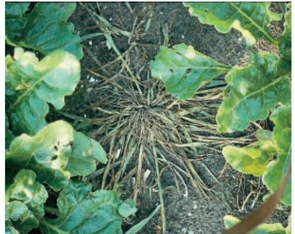
Graminacee: sono di facile controllo su tutte le dicotiledoni.

Equiseti. Vediamo aggravarsi il problema di anno in anno. Incide il cattivo scolo delle acque, ma anche il perseverare in taluni errori (dolosi e/o colposi). L'equiseto è colpito in pratica, e purtroppo non sempre con efficacia, coi prodotti ormonici (2,4 D, MCPA ed altri), quindi solo in colture come grano, sorgo e mais. Ancora ci soccorre la rotazione e poi trattare "approfittando" delle dette colture. Gli "ormonici" sono erbicidi non molto "graditi" per alcune presunte loro qualità negative e quindi se ne è avuto un notevole calo di impiego. Può essere cosa buona, ma per la lotta agli equi-