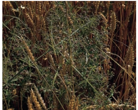
Galium : occorre approfittare della coltura del frumento per avere una efficace lotta chimica.

diversi "passaggi" che l'erbicida compie. Da chi lo produce e/o lo commercializza, da chi lo consiglia e ne detta la tecnica applicativa ed infine dall'agricoltore.