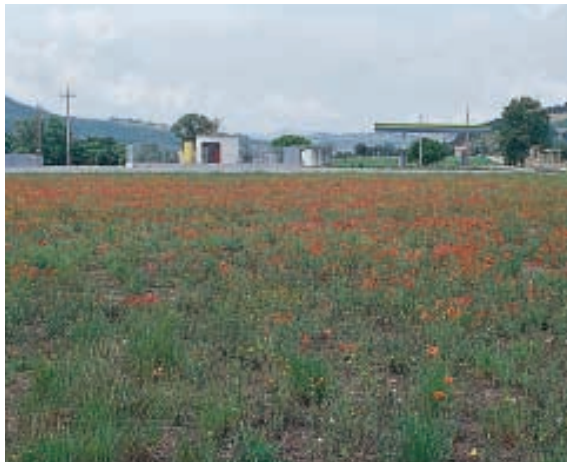
La buona gestione del set-aside consente di ottenere buoni risultati da questa pratica.

- Malgoverno del set-aside. Un oculato impiego di